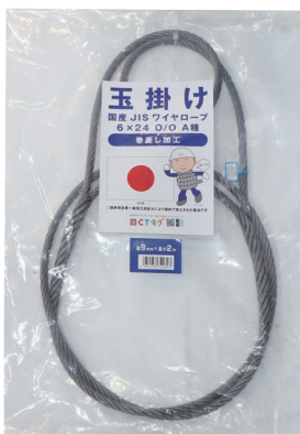
編込み加工(巻差し)