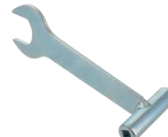
ボンベ開閉用スパナ