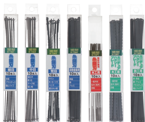
H-1261 H-1262 H-1263 H-1264 H-1271 H-1501 H-1502