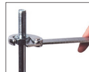
貫通ボルト・ナットの取り付け