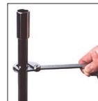
配管パイプの締め付け