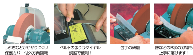
しぼきなどがかりにくい 保護カバー付外方向回転