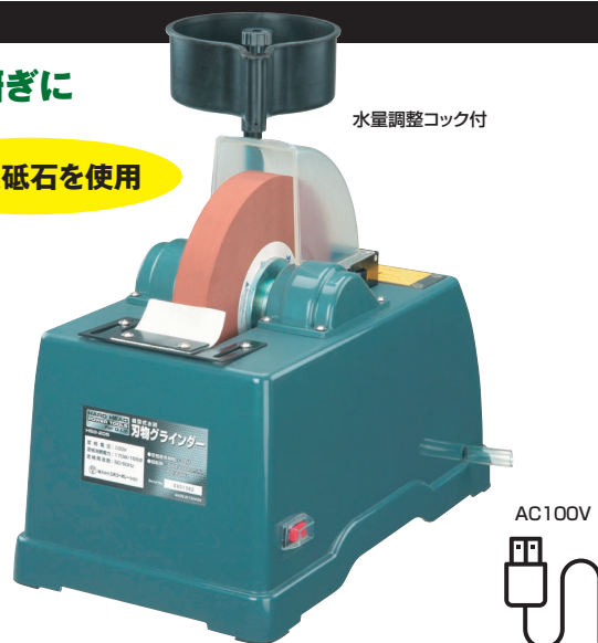
鎌などのR状の刃物も 上手に磨けます!