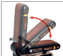
ベルトサンダーは 水平・垂直にも使用可能!