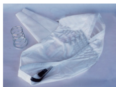
専用ダクトパック