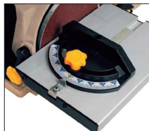
ワークテーブルは45°可変でき、 作業効率アップ!