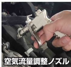
空気流量調整ノズル