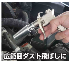
広範囲ダスト飛ばしに