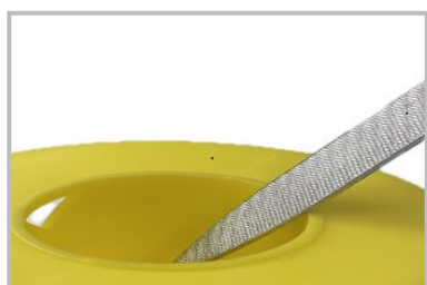
プラスチックの加工