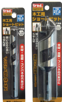
インパクト12V対応 (21mmまで)

【適応機種】 電動ドリル ドリルドライバー インパクトドライバー (12V以上/21mmまで) ボール盤