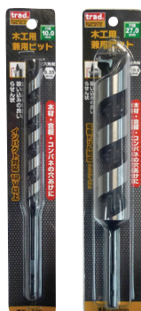
インパクト12V対応 (21mmまで)

【適応機種】 電動ドリル ドリルドライバー インパクトドライバー (12V以上/21mmまで) ボール盤