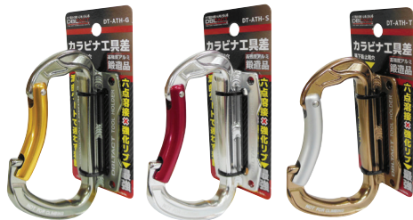
DT-ATH-G DT-ATH-S DT-ATH-T