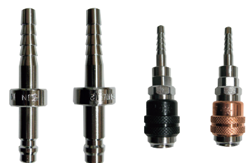
No.416 No.417 No.420 No.421