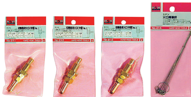
No.211 No.212 No.213 No.214