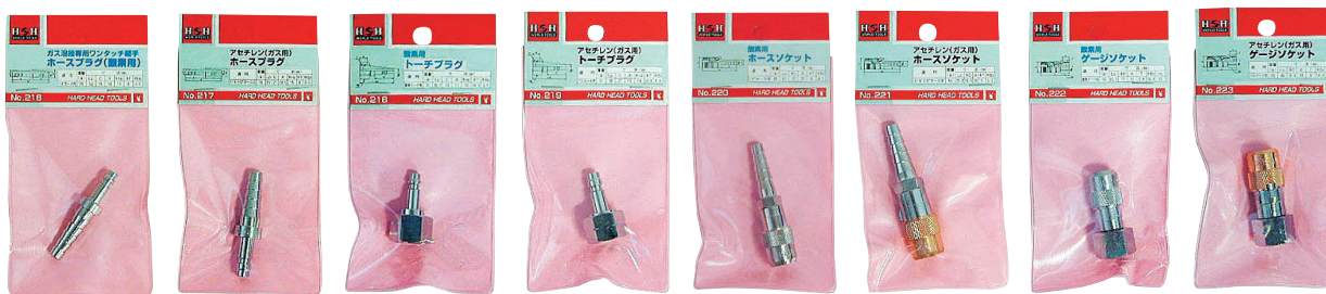
No.216 No.217 No.218 No.219 No.220 No.221 No.222 No.223