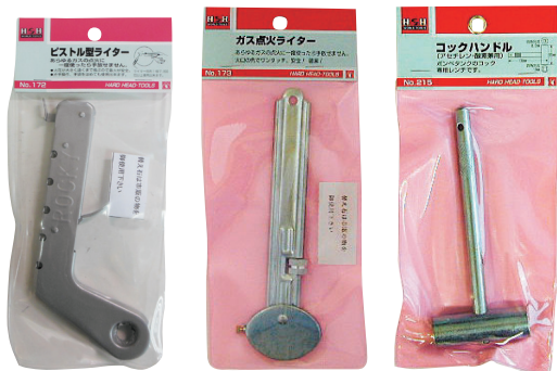
No.172 No.173 No.215