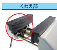
棒などの固定に便利なV溝加工