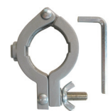
電機ドリル用 アングルクランプ 【取付け六角棒付き】 ●ネック径:38~43mm