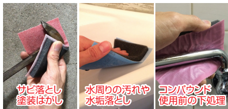
サビ落とし 塗装はがし