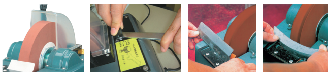
しぶきなどがかりにくい保護カバー付外方向回転 ベルトの張りはダイヤル調整で便利! 包丁の研磨 鎌などのR状の刃物も上手に磨けます!