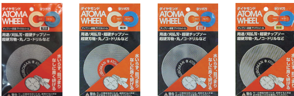
砥粒#140(粗目) 砥粒#400(中目) 砥粒#600(細目) 砥粒#1200(極細目)

ダイヤモンド(アトマ)ホイールは付属のリングを使用しますとディスクグラインダーでも使用できます。