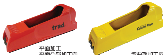
平面加工 平面凸部加工向