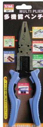
ワイヤーストリッパー