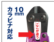
カラビナ 10mm 対応