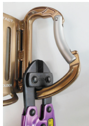
10mmカラビナに 掛けることができます!